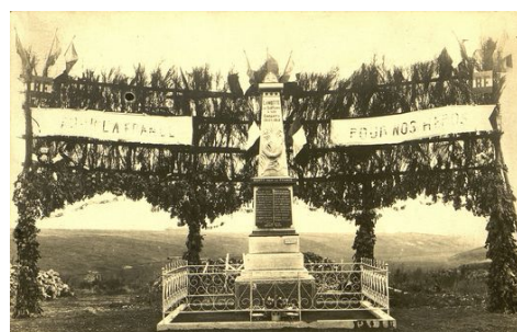
Inauguration du monument de Lamotte-en-Santerre ADS - 8 Fi 6033/1-4

Latitude : 49.8841171. Longitude : 2.304211900000041.